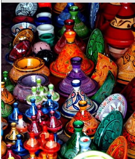
Filippo Piana, quinta Ginnasio